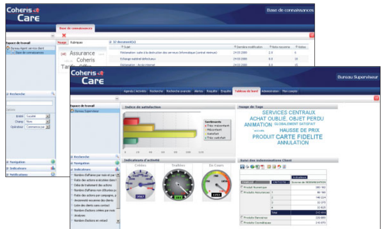
Base de connaissances et Tableaux de bord de l'activité (KPIs)